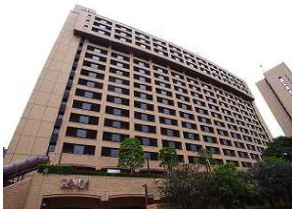
ショッピングセンター(ラムラ)もある駅ビル 飯田橋セントラルプラザ